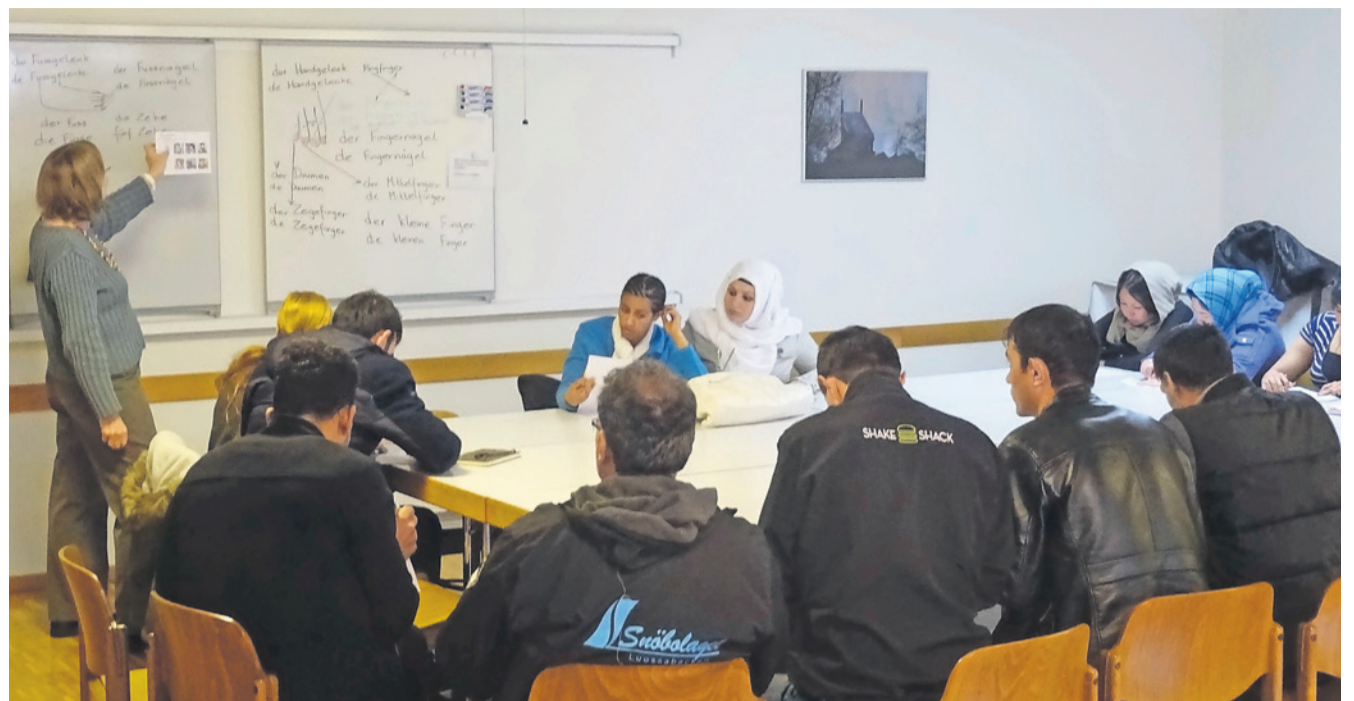
Im Kirchgemeindehaus St. Peter und Paul in Winterthur geben Freiwillige Deutschkurse an Flüchtlinge.

«Freiwilligenarbeit können grundsätzlich alle machen. Dies beginnt im jungen Alter mit einer Leitungsfunktion in der Pfadi, über erste Vereinsaktivitäten bis hin zu Sport und Politik.» Rohner betont auch die Wichtigkeit von «stillen Helden». Dies sind Menschen,